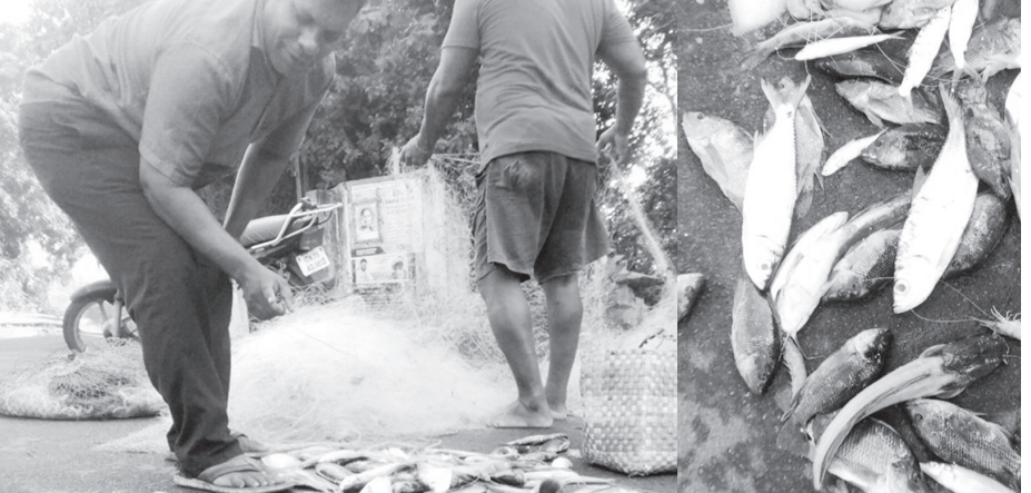
மாமல்லபுரம் பக்கிங்காம் கால்வாயில் சிக்கும் கடல் மீன்களை வாங்க ஆர்வம்