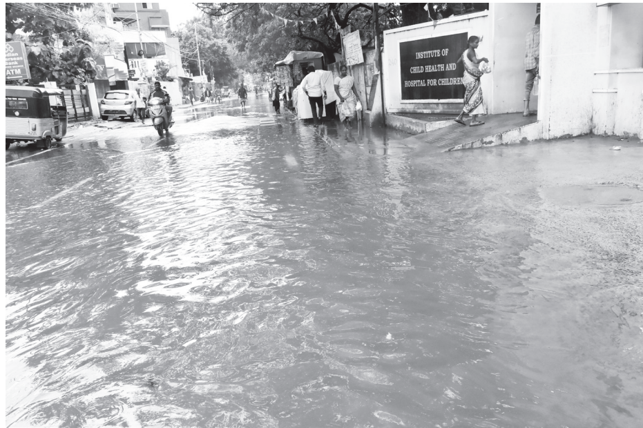
எழும்பூர் குழந்தைகள் நல மருத்துவமனை முன்பு தேங்கிய மழை வெள்ளம்